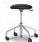
팝콘 스툴 (이동형) FCH0106CL Ø360×480~615 Leather : L438P, L439P, L429P