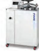
고압멸균장치 (AUTOCLAVE) XLX0401 470×680×600 (40L) XLX0402 470×680×880 (60L) XLX0601 630×810×950 (80L) XLX0602 630×810×950 (100L)

ULPA & HEPA 필터 (완벽한 집진 효과) 9단계 풍력 조절 LCD Microprocessor Controller 우수한 내구성 및 각종 편의장치 필터 교체 주기 알림 기능 저소를 저진동 블로어 팬 모터