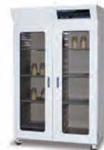
밀폐형 필터식 시약장 XLX1202 1250×760×2005

잠금장치 및 저소를 설계 내부식성 설계 (내부 ABS 사출 성형) 덕트 배기식 환기 시스템 완벽한 밀폐 도어 독립 공간에 분리 보관 공기 역류 방지