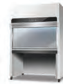
크린벤치 (무균작업대, Biological Safety Type) XLX1004 1000×880×1940 XLX1304 1300×880×1940 XLX1604 1600×880×1940

내약품성 재질 / 청정한 덕트 배기 방식 슬라이딩 도어 / 110V/220V 콘센트 적용 저소를 Sirocco Fan 장착 내장형 벨브 및 조작 스위치(실험자 안전 확보)