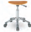
스툴 (이동형) FCH0501CW Ø350×435