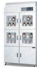
밀폐형 환기식 시약장 (6 Rooms) XLX1201 1240×760×2200

잠금장치 및 저소를 설계 내부식성 설계 (내부 ABS 사출 성형) 덕트 배기식 환기 시스템 완벽한 밀폐 도어 독립 공간에 분리 보관 공기 역류 방지