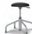
팝콘 스툴 (고정형) FCH0107GL Ø360×455~590 Leather : L438P, L439P, L429P