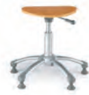
스툴 (고정형) FCH0501GW Ø350×415