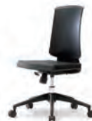
실험실 의자 DCH1800SPU DCH1801SPU (대전방지용) 679×662×895