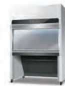
크린벤치 (무균작업대, Vertical Type) XLX1005 1000×880×1940 XLX1305 1300×880×1940 XLX1605 1600×880×1940

ULPA & HEPA 필터 (완벽한 집진 효과) 9단계 풍력 조절 LCD Microprocessor Controller 우수한 내구성 및 각종 편의장치 필터 교체 주기 알림 기능 저소를 저진동 블로어 팬 모터