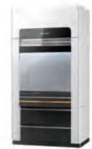
흡후드 (배기기) XLX1003 1000×650×2150 XLX1203 1200×760×2300 XLX1503 1500×760×2300 XLX1803 1800×760×2300

완벽한 밀폐 도어(마그네틱 게스킷 적용) 내부식성 설계 (내부 ABS 사출 성형) 원터치 필터 교체 방식 사용자 중심의 안전 설계 고효율, 저소를 강력 모터 적용