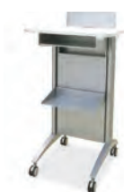
LTT0602 600×540×1150 Painting : KC180