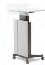
LTT0701 700×582×1095~1245 Painting : KC175, KC114