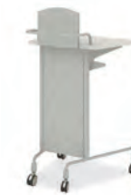
LTT0601 598×551×1150 Painting : KC180