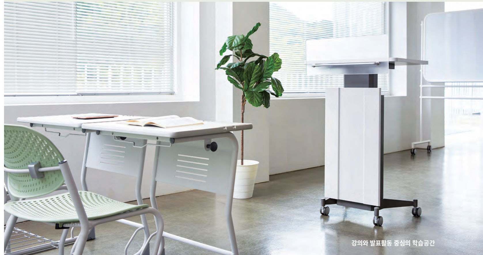
강의와 발표활동 중심의 학습공간