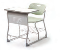
상판 슬라이딩형 LRD6506 650 × 940 × 720 상판 고정형 LRD6507 650 × 918 × 720