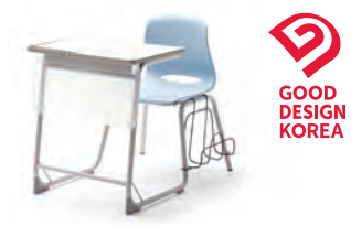
상판 슬라이딩형 LRD6504 650 × 933 × 785 상판 고정형 LRD6505 650 × 933 × 785