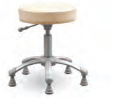
기본형 FCH0500GL Ø360 × 470-580 최저 최고 470 스틸 파이프 위 분체도장 마감 오발 높낮이 조절 기능 사출 성형 플라스틱 글라이드 및 마감 캡