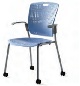
팔걸이형 DCH0600CPP 615 × 532 × 890 최저 최고 395 플로팅 백레스트 테크놀로지 수직적층