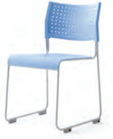
기본형 DCH0800GPP 491 × 545 × 785 최저 최고 420 플라스틱 성형 사출 등판 스틸 파이프 위 분체도장 마감 다리프레임 수직 적층 시스템 미끄럼 방지 및 충격완화 글라이드