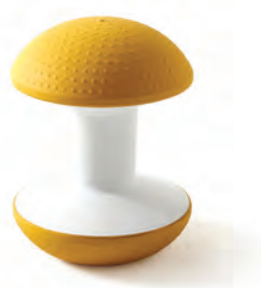
스툴 FCH0300 Ø452 × 622